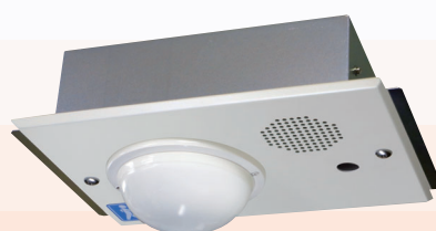
埋込型(センサ露出)