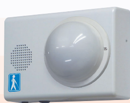
露出型(センサ露出・屋内)