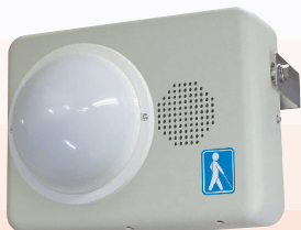
露出型(センサ露出・屋外)