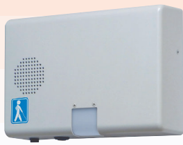
露出型(センサ内蔵・屋内)