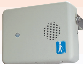
露出型(センサ内蔵・屋外)

●センサの検知エリアに入ると作動し音声(チャイム音)が鳴る音声機器です。センサユニットは外部接続対応も可能です。