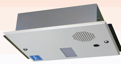
埋込型(センサ内蔵)