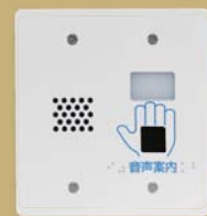
ユニットBで 『インフォメーション』

— [ユニットA]・[ユニットB] 2つのユニットから音声でサポートいたします。 —