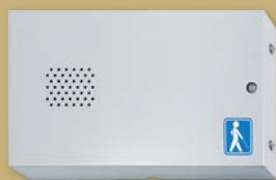
ユニットAで 『ナビゲーション』