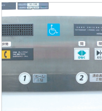
エレベーター点字標示板